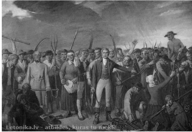
4. Letonika.lv - atbildes, kuras tu mekle