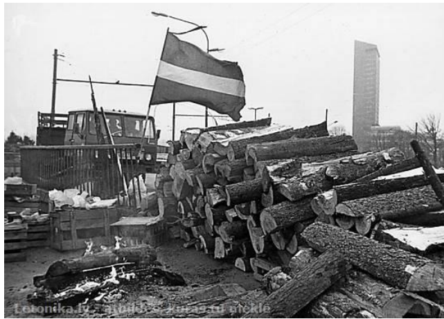
5. Letonika.lv - atbildes, kuras tu mekle